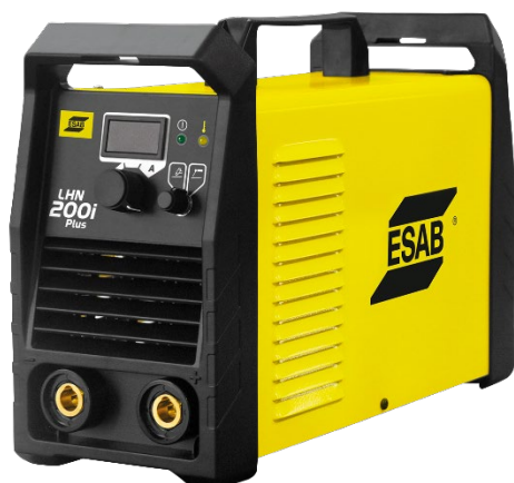
LHN 200i Plus

Конструкция аппарата LHN 200i Plus имеет высокую прочность, мощность, надежность и другие характеристики, которые облегчают вашу повседневную работу - например, цифровую панель индикации, длинные сварочные кабели и несколько ручек для переноса аппарата.